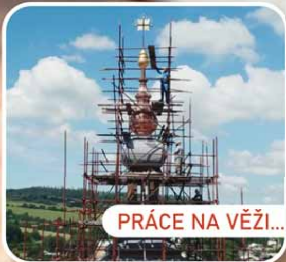
PRÁCE NA VĚŽI...