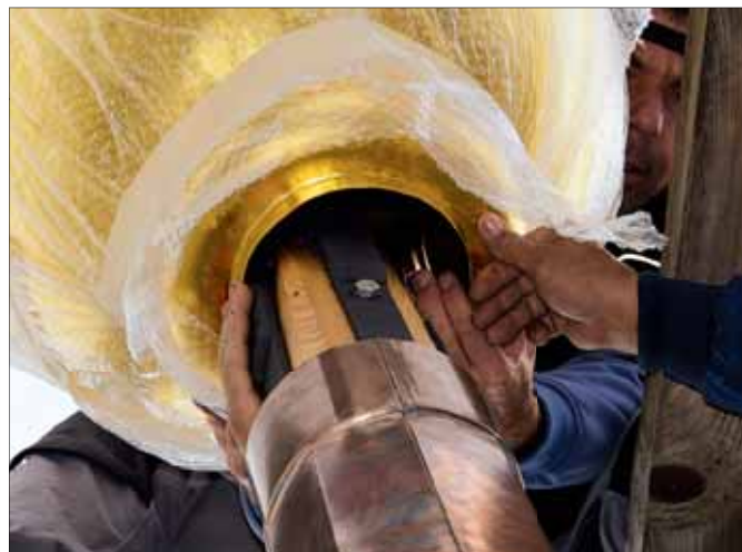
V Budišově nad Budišovkou dne 13. 7. 2020.

Milí občané našeho města, rok 2020 je velkou zkouškou nejen pro nás občany, ale i pro naše město, náš kraj, náš stát. Svět zahltil virus COVID 19 a vše, co jsme brali jako samozřejmost, je