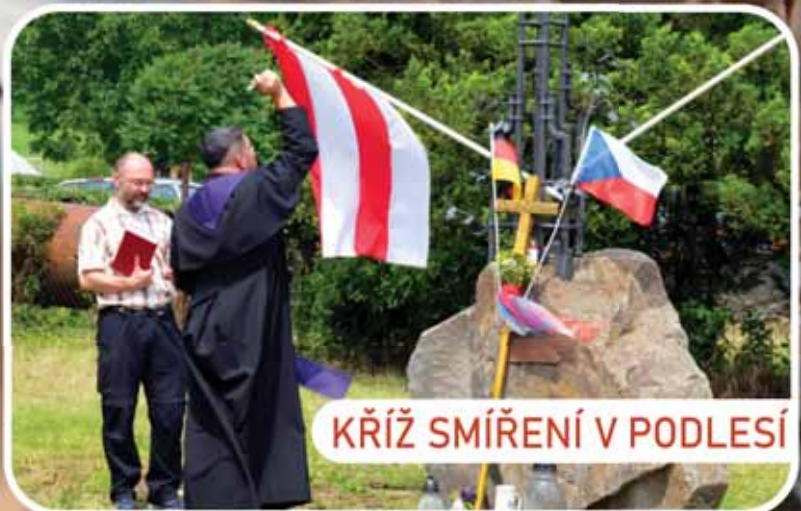
KŘÍŽ SMÍŘENÍ V PODLESÍ